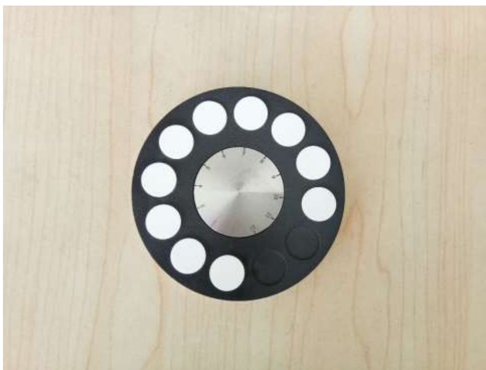
图 A.1 12 位样品盘